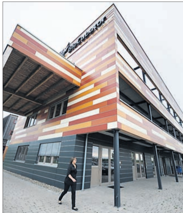
Investition in die Zukunft: Im Straubinger Gründerzentrum „Biocubator“ werden neue Umwelt- und Energietechniken erforscht und entwickelt. Der Schwerpunkt liegt dabei auf der Rolle von nachwachsenden Rohstoffen wie Holz oder auch Baumwolle.

Auch die Landshuter Hochschule will den Bedürfnissen der regionalen Wirt-