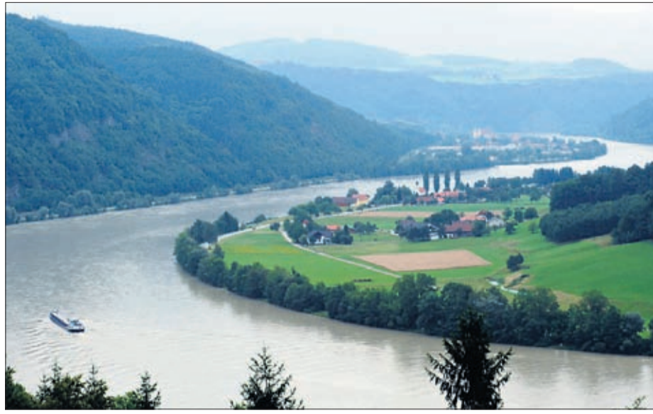
Das Spektrum des zweitgrößten bayerischen Regierungsbezirks Niederbayern ist groß. Von links: Die Donau bei Passau. Die Holzwirtschaft spielt vor allem im Bayerischen Wald eine bedeutende Rolle. BMW produziert Autos in zwei Werken in Landshut und Dingolfing. Ganz rechts die Befreiungshalle auf dem Michelsberg bei Kelheim.