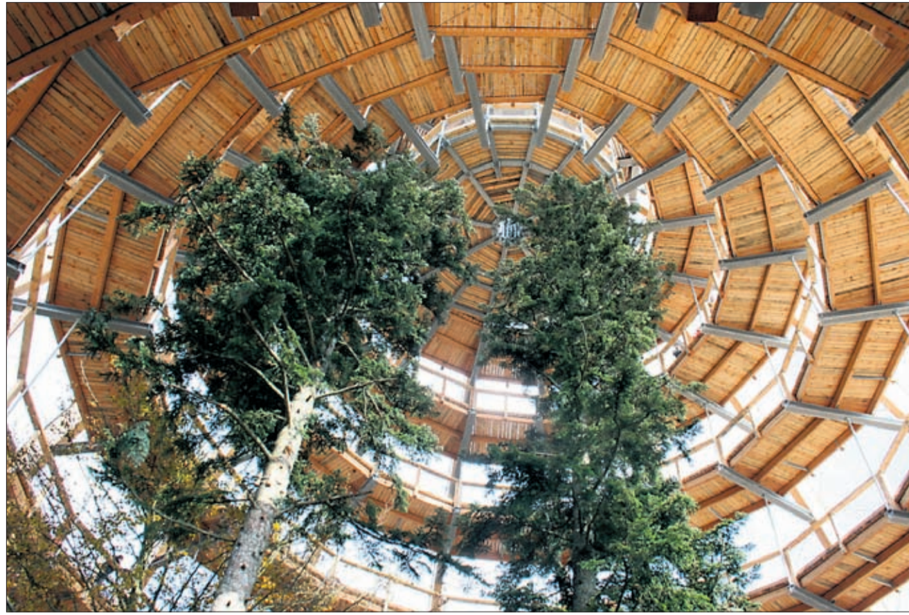
Bis über die Baumkronen führt der 1300 Meter lange Wipfelweg im Nationalpark Bayerischer Wald.

Neuer Besuchermagnet ist seit einem Jahr der weltweit längste Baumwipfelpfad. Knapp 300 000 Touristen erkundeten bisher den 1300 Meter langen Weg und wagten sich auf den 44 Meter hohen Baumturm. „Sie erleben die Perspektive des Waldes in allen Etagen“, sagt Pöhlmann. Mit etwa sieben Millionen Gästen im Jahr ist der Bayerische Wald eines der führenden Tourismusgebiete Bayerns. Die Luft ist sehr sauber, deshalb dürfen sich auch 18 Gemeinden Luftkurort nennen. Im Sommer finden die Urlauber zahlreiche Wanderwege, im Winter haben sie die Qual der Wahl, wenn es um die schönste Langlaufstrecke im Schnee geht: Etwa